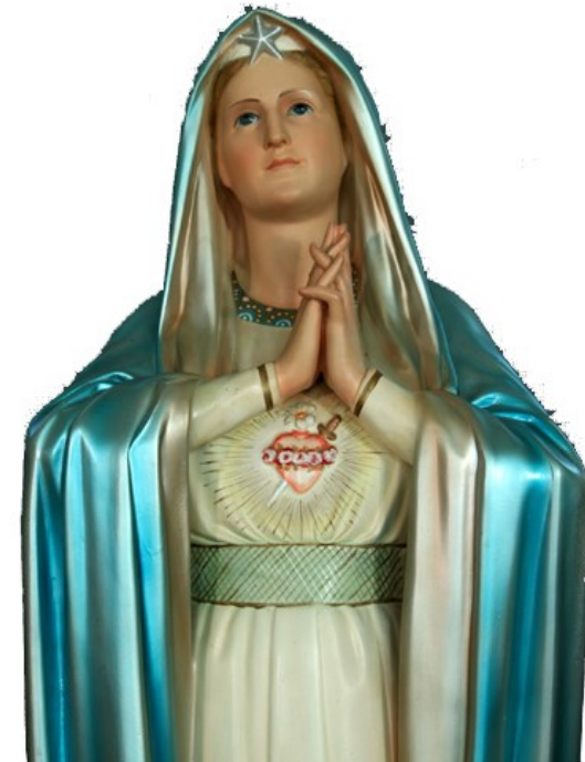
Cœur Immaculé de la bienheureuse Vierge Marie

Le comptoir d'entraide St-Donat est ouvert du lundi au vendredi de 10h30 à 15h00 ainsi que le premier samedi de chaque mois